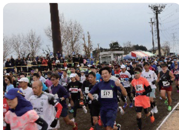
元気あっぷハーフマラソン大会