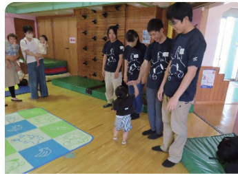
高根沢リーダーズクラブ