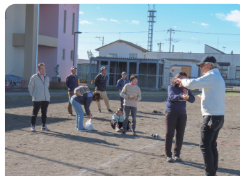
ペタンク出前講座