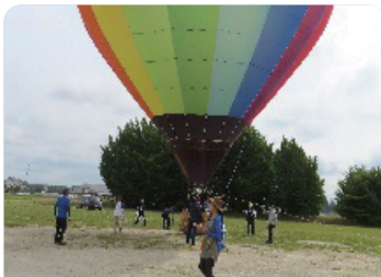
小山文化スポーツ振興事業 (演劇で遊ぼう)