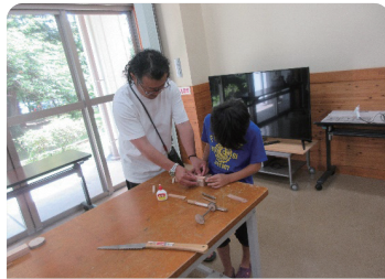
夏休み! たんたん探検隊