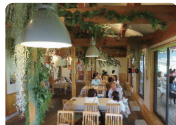
たんたん婚活たかねざわ