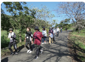
ウォーキング大会