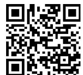
申込フォームQRコード