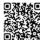
高根沢町 各種申請書

《 高根沢町役場 産業課 産業政策係 》 〒329-1292 栃木県塩谷郡高根沢町大字石末 2053 TEL 028-675-8104 FAX 028-675-8114 E-Mail machi@town.takanezawa.tochigi.jp