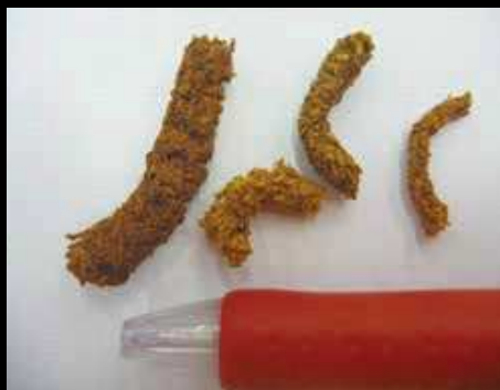
木くずと幼虫の糞が固まって かりんとう状となる