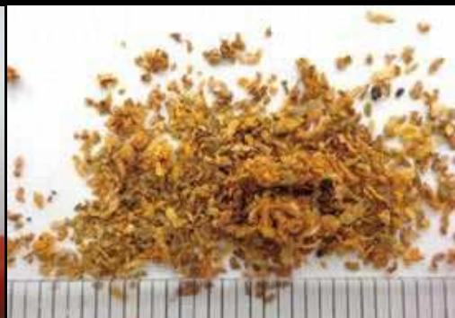
フラスの内容物にはノミで削ったような 薄い木くず片が含まれている