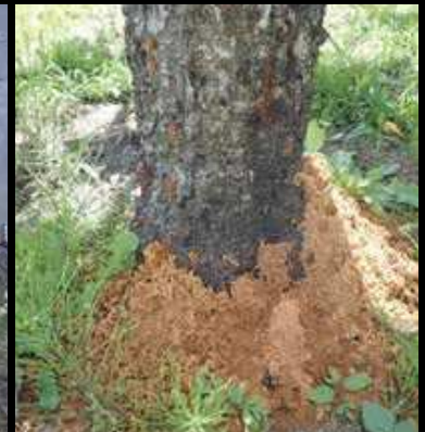
赤茶色のフラスが株元に積もったサクラ(左)とモモ(右)