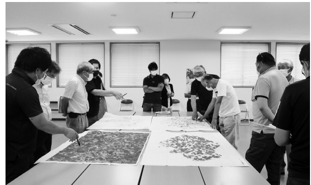
(令和4年8月3日開催の大谷地区懇談会)

●人・農地プランに関するお問い合わせ先 町産業課 (TEL: 028-675-8104)