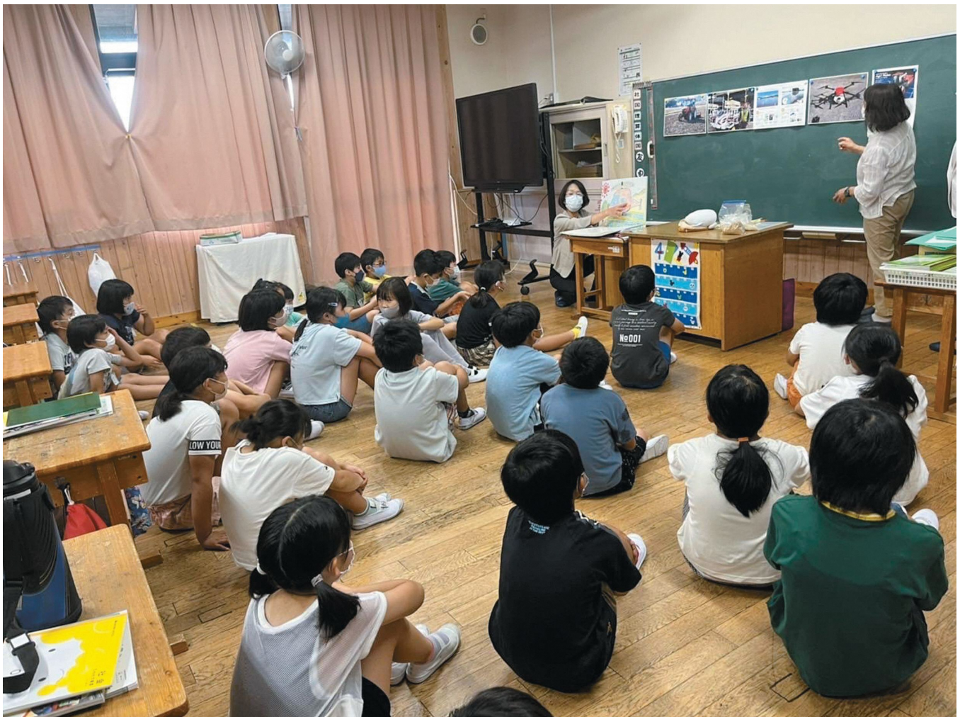
女性農業士による食育活動の様子（高根沢町立北小学校）

令和4年9月 第132号 編集・発行 高根沢町農業委員会 高根沢町大字石末2053 TEL 675-8108