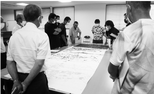
(令和4年8月2日開催の桑窪地区懇談会)