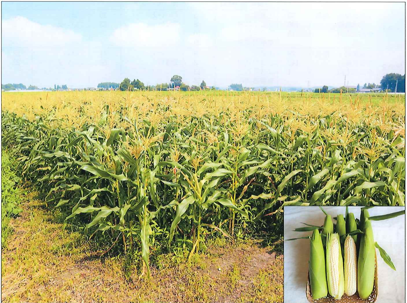
とうもろこしの収穫（花岡）

令和2年9月 第128号 編集・発行 高根沢町農業委員会 高根沢町大字石末2053 TEL 675-8108