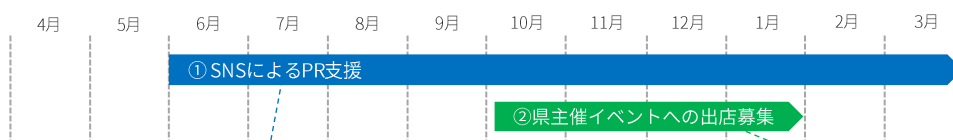
情報提供スケジュールイメージ

「いちご王国」公式SNSを通して、協賛事業者様をPRします。 PR内容の募集等のやりとりをslackで行う予定です。