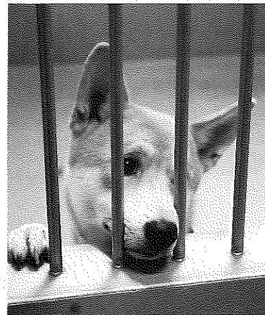
収容施設で飼い主を待つ迷子犬