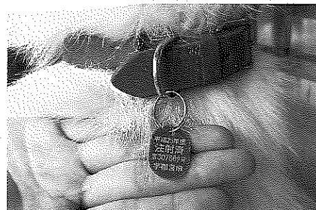
リングを使った取り付け方法