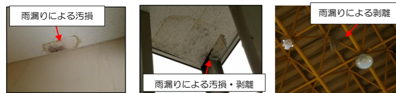
農村環境改善センター