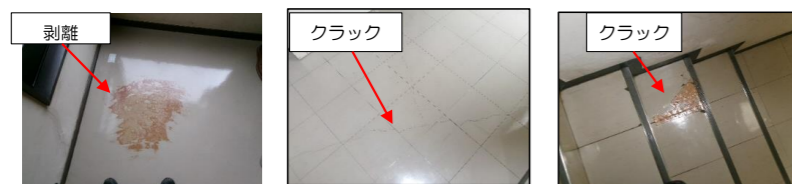
農村環境改善センター