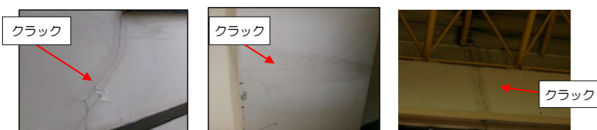
農村環境改善センター