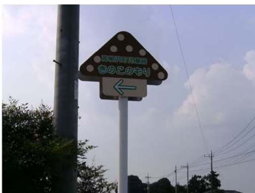
児童館きのこの森